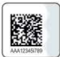
Защищенный материальный носитель (вид 3)