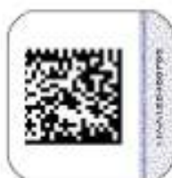
Защищенный материальный носитель (вид 2)