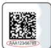
Защищенный материальный носитель (вид 3)