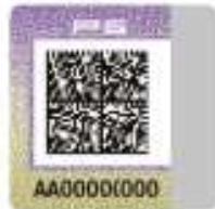
Унифицированный контрольный знак