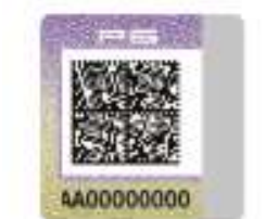
Унифицированный контрольный знак