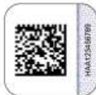
Защищенный материальный носитель (вид 2)