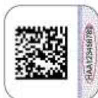
Защищенный материальный носитель (вид 2)