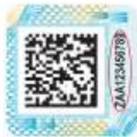
Защищенный материальный носитель (вид 1)