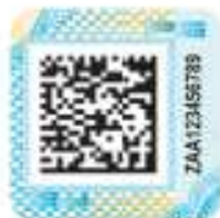
Защищенный материальный носитель (вид 1)