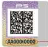
Унифицированный контрольный знак