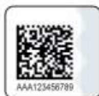
Защищенный материальный носитель (вид 3)