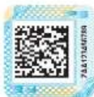
Защищенный материальный носитель (вид 1)